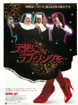
「天使にラブ・ソング」ミュージック・コメディ映画をニコニコ本陣の劇場で鑑賞しました。