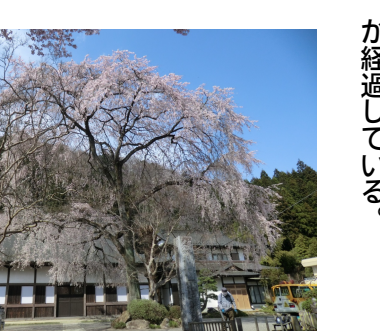
普門寺のしだれ桜