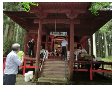
木乃峯観音寺祭典準備

言われている。この堂は中禅寺第三番と号され、本尊千手観音菩薩は中禅寺(第一番)立木観音の末木で彫り上げられた五尺の立像で、上人の作と言われている。惜しいことに、明治の時期に堂ごと火災