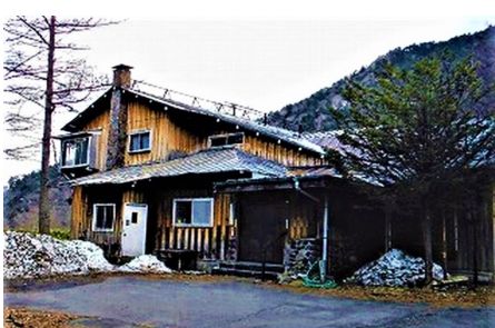
晃元荘正面 (日光湯元温泉保養所)