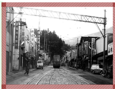
旧日光警察署御幸町停留所前