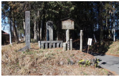
日光市山口 杉並木寄進碑