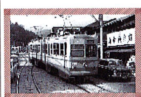
旧日光警察署 御幸町停留所前