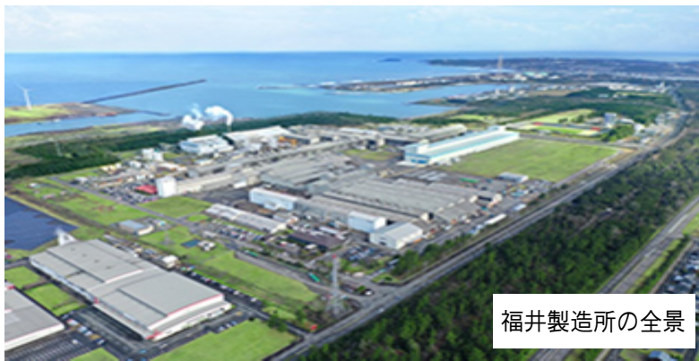
福井製造所の全景