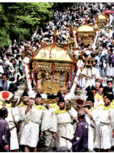
三神輿=徳川家康公・源頼朝公・豊臣秀吉公

日光二荒山神社弥生祭は「日光山三月会縁起」「満願寺三月会日記」などの資料によると神護景雲元年(767年)に始まったとされているとても古い時代からの祭りである。3月は、「弥生」なのでそこから「弥生祭」とつけられた。その当時は旧暦が用いられていたが、明治6年(1873年)から太陽暦が使用されるようになり、4月に行われるが現在も「弥生」が使われている