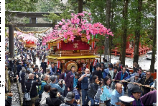
付祭り各町家体繰込み 4月17日