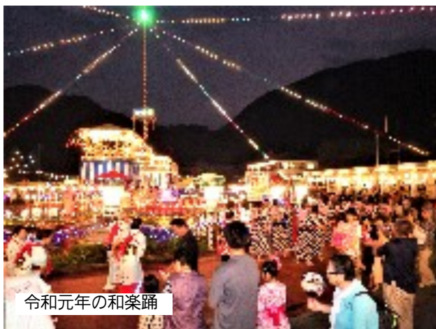
令和元年の和楽踊