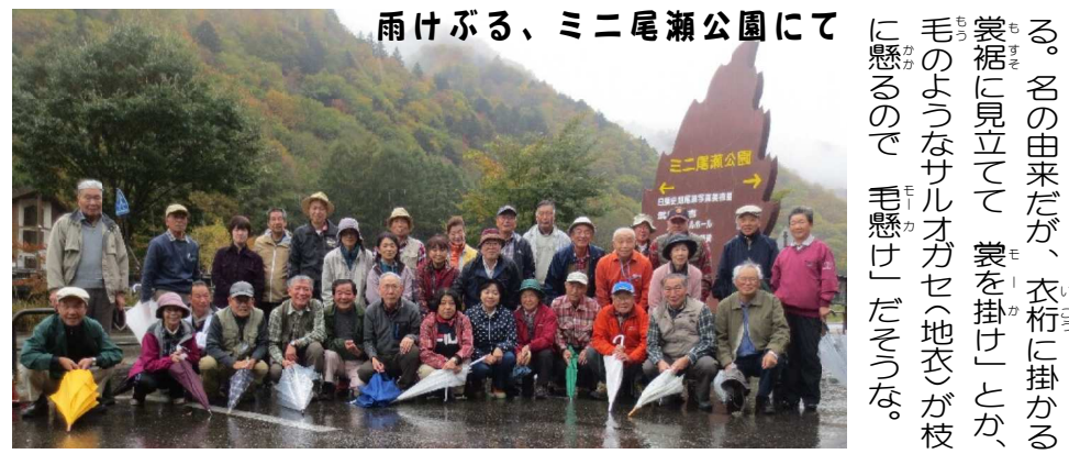
雨けふる、ミニ尾瀬公園にて

傘こうかい部 10月19日(木) 台風21号の影響で雨。でも34名はおくせすし、7:15、下野大沢駅前を出発。道の駅たじまで小休止後、恒例のポンゴで盛り上がった。出された賞品がふるって、一番が必ずしも豪華品！ではなく、むしろ予想外の等に当たるものスリルの中と言える。雨が止まないの、やむなく、当初の桜枝岐・尾瀬沼の2コースから、部長提案の新しいコースを選び、モーカケの滝(落差50m)写真へ。駐車場から細道を徒歩で15分ほど分け入