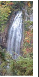
三尾瀬公園の売店で昼食後、

散策。尾瀬写真美術館は山岳写真家白旗史朗の記念館。武田久吉記念館の主人公は初代日本山岳協会会長で、英国外交官アーネスト・サトウと武田兼の子。1883年(明治16年)生れ。父子が日光の山をこよなく愛したのを特筆したい。バス移動少々。燗の湯(500円)で疲れ?を取る。"目一杯、歩いた時に入りたいよな"の声。帰路もビンゴ。きままるの話芸(映像)に吹き出す。玄梅日光山岳連盟元理事長の解説で、奥日光の自然探索ガイドのビデオを鑑賞。