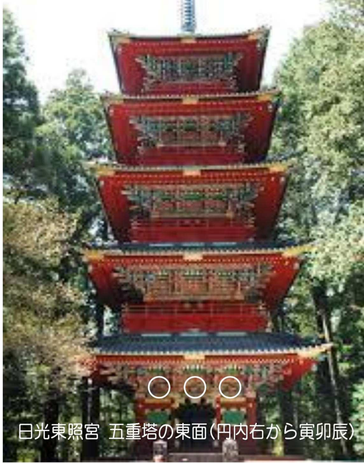
日光東照宮 五重塔の東面(円内右から寅卯辰)